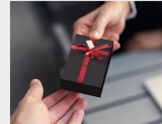
... als Mitarbeiterpräsent