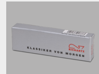
... mit Standardverpackung