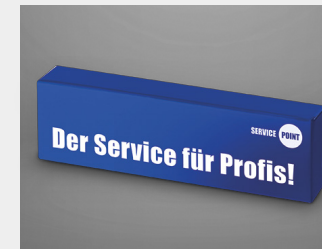
... als Promotionartikel / Prämie