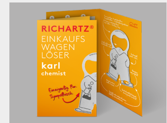
... mit Standardverpackung