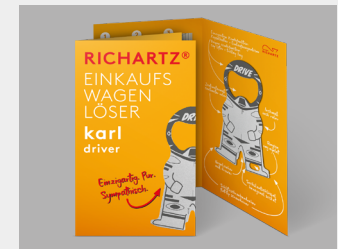
... mit Standardverpackung