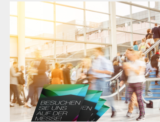
... als Streuartikel