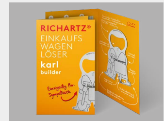
... mit Standardverpackung