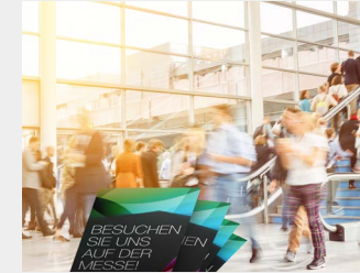
... als Streuartikel