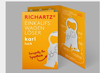
... mit Standardverpackung